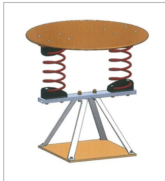
FONDATION PLATEAU SUR RESSORTS