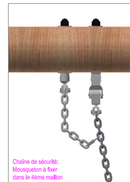
Chaîne de sécurité: Mousqueton à fixer dans le 4ème maillon